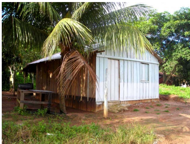
Foto 9- Residência de uma das crianças da pesquisa (vila)

As crianças da roça se relacionam com o mundo exterior através de inúmeras transações. As famílias que moram na vila e trabalham na roça, mas ficam no local de trabalho durante toda a semana, nos finais de semana se deslocam para a vila. As famílias que trabalham e moram na roça, mantêm vínculo com a vila por relações de parentesco, o que é comum. São essas relações que permitem, não na mesma intensidade, o trânsito das crianças pela vila e o acesso a seus espaços. O inverso também acontece: as relações de parentesco atraem as crianças da vila para a roça nos finais de semana e no período das férias escolares.