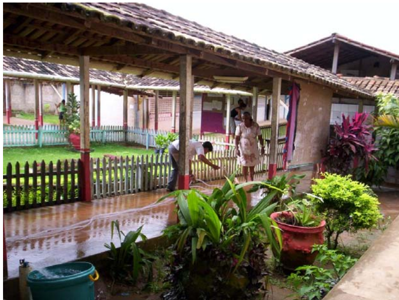
Foto 6- Escola Crescendo na Prática (prédio atual)