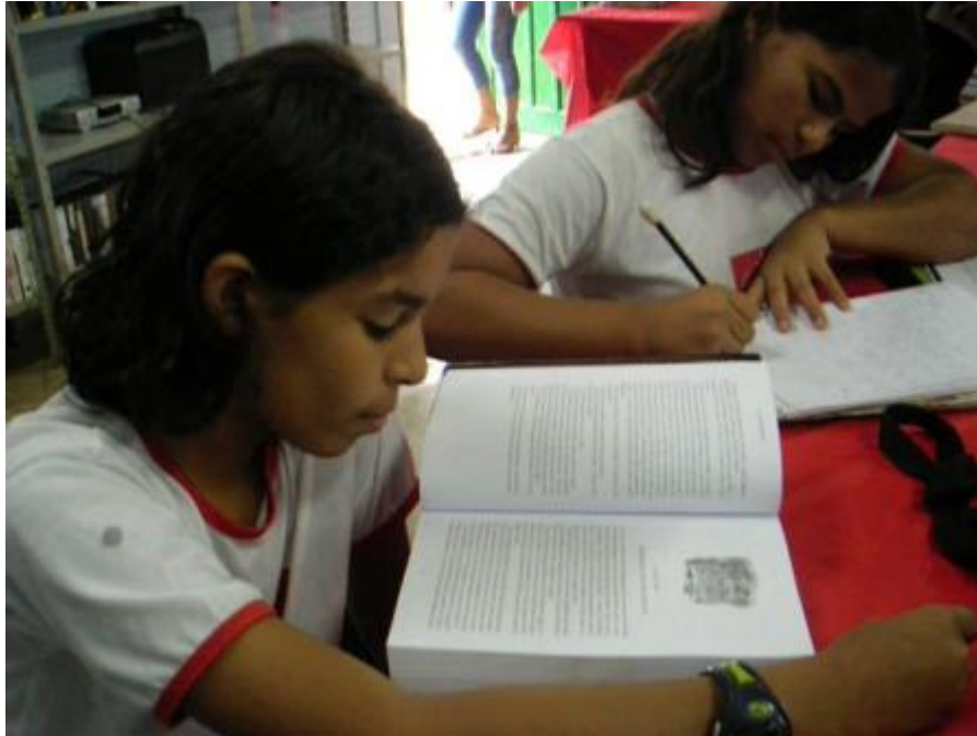
Foto 14- Crianças na biblioteca

O ir e vir das crianças neste novo espaço, movimento acompanhado do ato de escrever o nome em um caderno e levar um livro para casa me inspirou a conhecer esses registros. O caderno de empréstimo informava sobre os mais diversos leitores: da criança em processo de alfabetização ao adulto, morador do Assentamento, aluno ou não da Escola. Estava, pois, diante de acontecimentos muito instigantes, dos quais não pude mais me afastar, o que ampliou sobremaneira o horizonte do trabalho. Nesse processo, a biblioteca foi um lugar que passei a freqüentar muito mais.