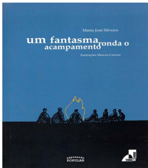
Figura 3- Capa do livro “Um fantasma ronda o acampamento”

No quadro que apresento, “Um fantasma ronda o acampamento” (Figura 3) foi o livro de maior destaque como marca de leitura coletiva. Provavelmente o discurso metafórico e o apelo ao mistério (quem era o fantasma que rondava o acampamento?) que predomina em parte do texto, e após descoberto, se transforma em aventura (expulsar o fantasma do acampamento), tenham sido fortes apelos à leitura da obra.