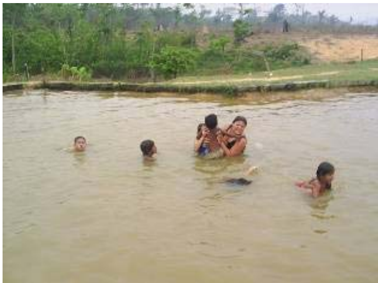
Foto 11- Banho de rio, lazer das crianças nos finais de semana

Por sua vez, o brincar tem uma característica particular, que é o sentido da “invenção” 41 , às vezes combinada com elementos da cultura, amplamente partilhados, como escolher os vencedores. Inventar está relacionado ao sentido de ser criança, marcas de um tempo, como disse Lefebvre (1969), em que viver a vida implicava produzi-la, incompatíveis com a racionalidade do o excesso e do descartável.