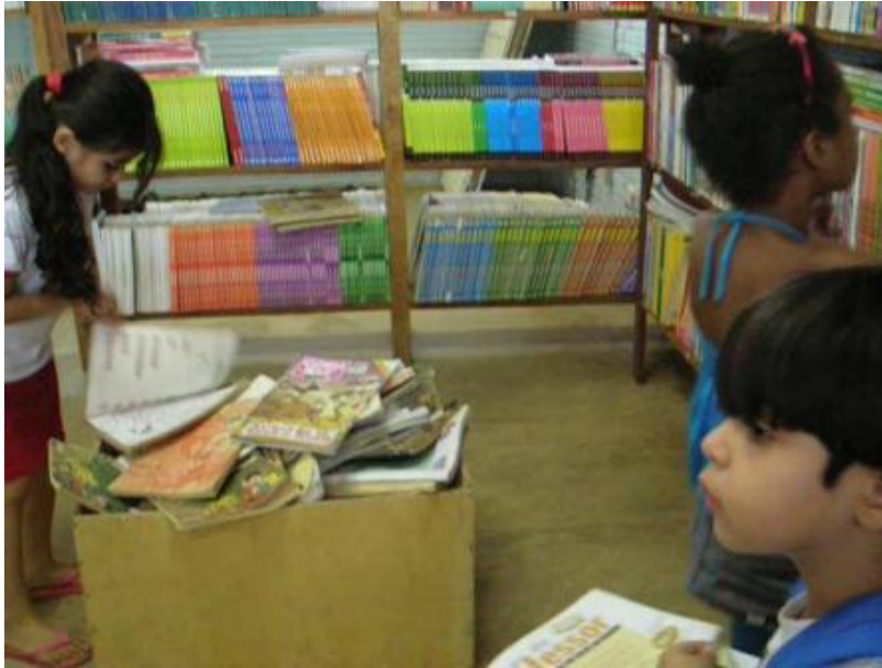
Foto 15- Crianças explorando livros na biblioteca

A sala de leitura era um ambiente mais familiar às crianças dos anos iniciais de escolarização, para as quais se destinam suas atividades. Ela existe desde o ano de 2001 como um projeto de leitura inicialmente vinculado à biblioteca pública do município de Parauapebas e, posteriormente, à Secretaria Municipal de Educação.