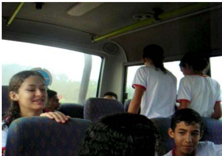
Foto 10- Crianças da roça no ônibus escolar

Às onze horas, a cena do início da manhã, se repete. Os ônibus levam as crianças de volta para a roça e trazem aquelas que estudam no segundo turno, que, por sua vez, retornarão às dezesseis horas, nos mesmos ônibus em que virão os estudantes do período noturno. Toda essa engrenagem funciona sob a direção da Escola. Se um ônibus quebra ou as estradas são interrompidas, o que acontece com frequência no inverno, as crianças ficam impossibilitadas de vir à vila.