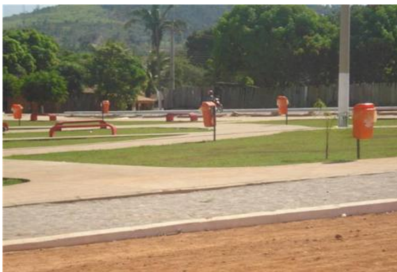
Foto 1- Praça do Assentamento

O Assentamento não é um espaço preenchido de um mesmo contínuo. Eletrificação (na vila e na roça), telefone (na maioria público), transporte coletivo, praça pública (Foto 1) pavimentação (Foto 2) e antena parabólica (Foto 3) são formas urbanas modernas que extrapolam a cidade e se entrecruzam com outras paisagens.