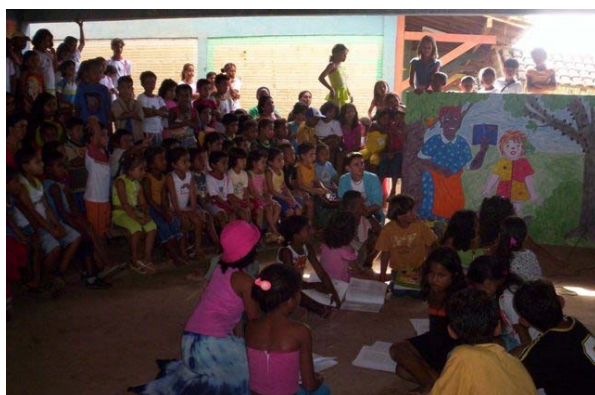
Foto 17- Projeto de leitura Monteiro Lobato

O campo de atuação da Escola é amplo. A ela não se pode imputar apatia, falta de compromisso com a educação das crianças, palavras bastante conhecidas quando se refere à escola pública. Contudo, há pelo menos dois aspectos fundamentais que precisam ser problematizados na atuação da Escola: qual a importância de ler livros de literatura para as crianças? Quais as finalidades das ações de promoção à leitura e a sua relação com o projeto de escola e de escola do campo?