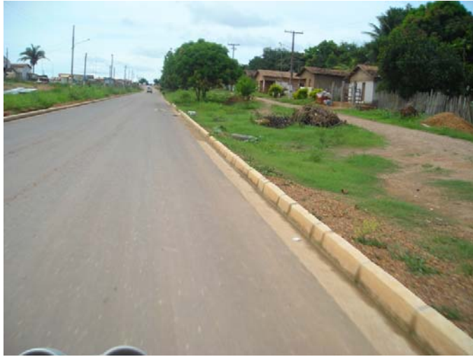
Foto 2- Rua principal do Assentamento