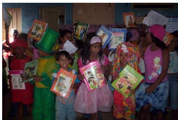
Foto 16- Projeto de leitura Monteiro Lobato

A Escola Crescendo na Prática cumpre um papel importante tanto na difusão da crença quanto em seu agenciamento prático. Além de elemento importante de mediação da relação das crianças com a linguagem literária, que se faz por dentro das salas de aula, celebra o livro em suas festas, combinando-o com outras formas de expressão, principalmente a plástica. No palco, o livro ganha visibilidade no corpo das crianças, nos pátios, como se pode observar nas fotografias que registraram as atividades de culminância do projeto “Monteiro Lobato” (Foto 16 e 17).