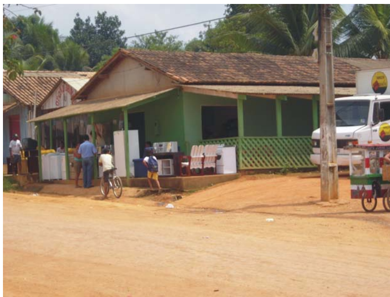
Foto 7- Comercialização de eletrodomésticos em frente a uma das casas do Assentamento

Ao comércio local se juntam outras formas de circulação de mercadorias. Grandes redes de lojas de departamento (Foto 7) improvisam locais para comercialização dos seus produtos. Há um processo em que o campo vai ao encontro da cidade, e outro, em que a cidade vem ao encontro do campo.