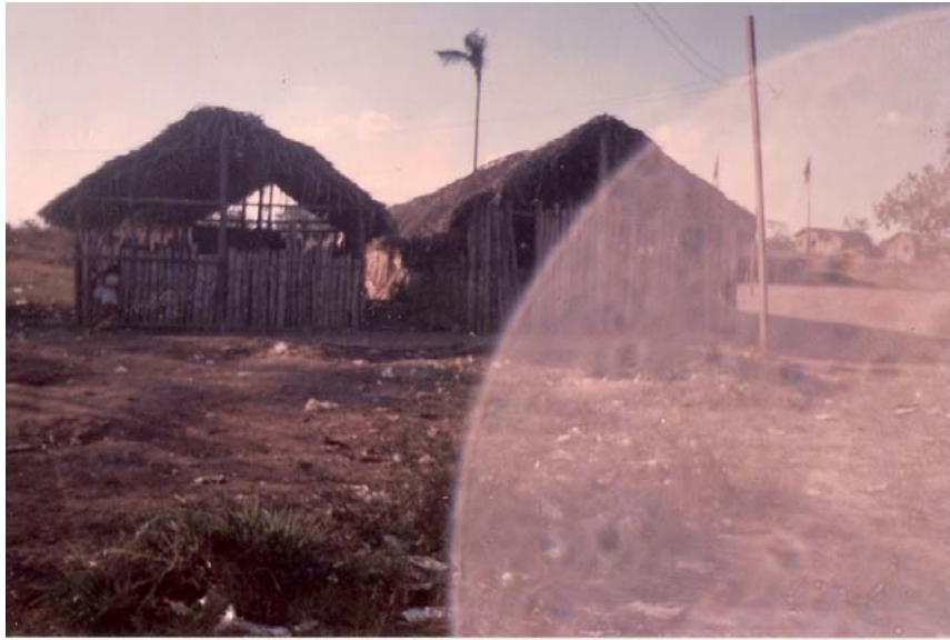
Foto 5- Primeira escola do Assentamento