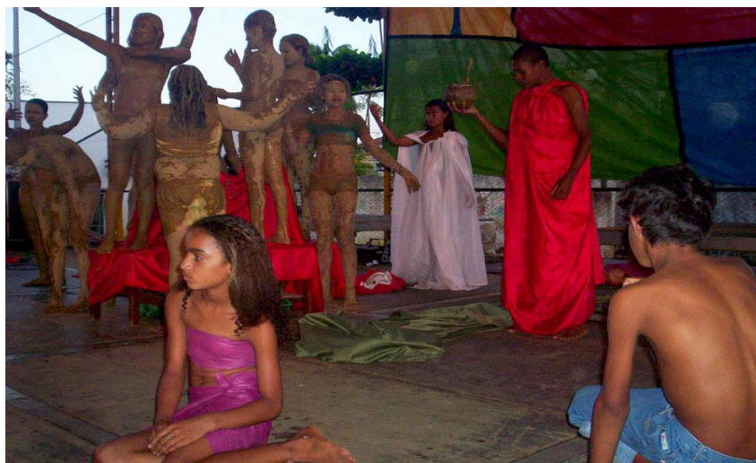
Foto 8- Mística encenada por crianças e jovens da Escola Crescendo na Prática

vivem a maior parte do tempo na roça, a esfera pública onde ganham visibilidade é a Escola. Juntamente com as crianças da vila participam das místicas, compõem e apresentam peças teatrais, atividade com a qual a leitura está diretamente relacionada, porque, segundo elas, é preciso ler para se inspirar. De algum modo, as crianças que compõem este estudo ocupam um lugar na esfera pública, fato que define o quanto o confinamento social e cultural que se atribui aos tempos modernos precisa ser confrontado com os movimentos do real.