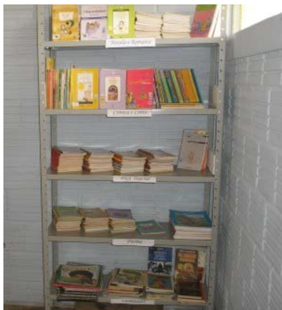
Foto 13- Estante da sala de leitura da Escola

O acervo do programa constituiu uma das fontes importantes de acesso a livros de literatura pelas crianças. Entretanto, os livros não chegaram as suas casas, apesar do programa ter publicizado em seus relatórios 47 o atendimento de 100% das crianças de Ensino Fundamental do país no período da sua vigência. Para uma escola de aproximadamente 1.200 estudantes nessa faixa de escolarização, a estante destinada ao acervo é ilustrativa da quantidade de livros a que a comunidade pode ter acesso (Foto 13).